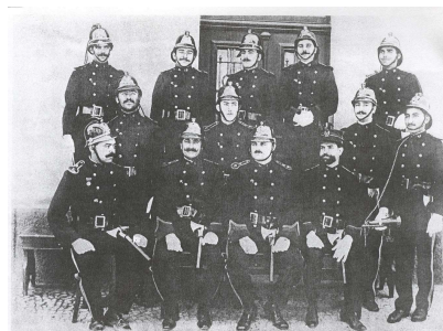
O Corpo de Bombeiros Voluntários da Estação de Incêndios n.º 3 de Carcavelos, após a inauguração do seu novo Quartel.