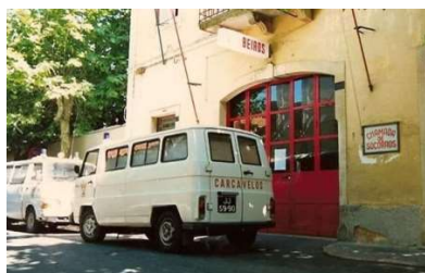
Quartel da Rua Júlio Moreira em Carcavelos