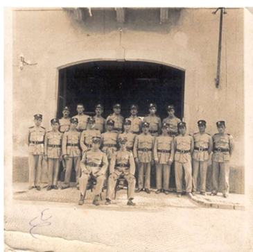
Primeiro Corpo de Bombeiros, aquando da passagem do antigo quartel (agora a Continsol) para a Rua Júlio Moreira - Inauguração ano de 1913