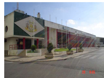
Quartel da Rua dos Bombeiros Voluntários de Carcavelos